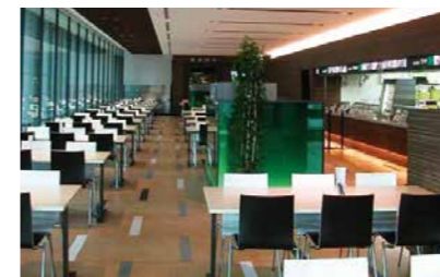
中之島ダイビルカフェテリア (大阪市北区)

旬の食材を活かした多彩なメニューをご提供しています。 パーティーやご宴会、同窓会など各種会合にもご利用いただけます。