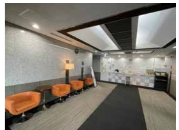
グリーンヒル恵比寿