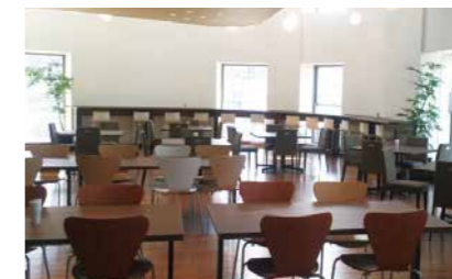
ダイビル本館カフェテリア (大阪市北区)