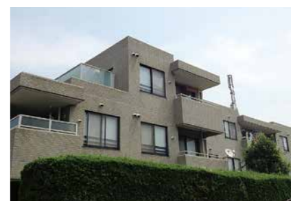
ランテルナ小石川