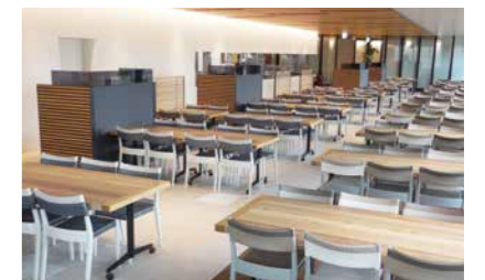
新ダイビルカフェテリア (大阪市北区)